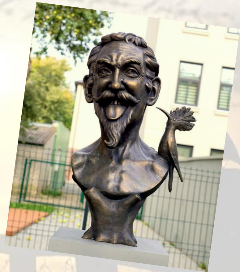
Augustino Kluodos bronzinė skulptūra „Kukutis“ Raseiniuose.