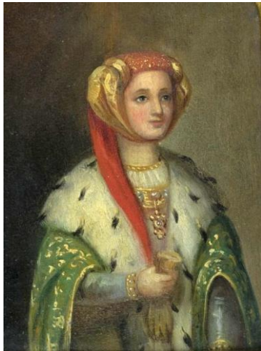
Marceli Krajewski (apie 1866-1870) Lietuvos didžioji kunigaikštienė Elena Ivanovna

Veikiančiame valdovo dvare Birštone XVI a. apsilankė mažiausiai keturi Jogailaičių dinastijos atstovai, o dar du su šia valda betarpiškai siejosi. Tarp Birštone viešėjusių buvo Aleksandras Jogailaitis (1461-1506), kuris po vedybų Birštoną kaip dovą, apie 1503 m., užrašė žmonai Lietuvos didžiajai kunigaikštieni Elenai Maskviškei (1474-1513).