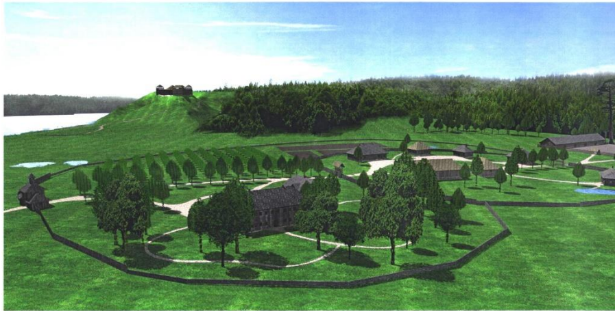
Birštono dvaro XVI a. rekonstrukcija

Viena ryškesnių Birštono dvaro funkcijų ir jo specifika buvo karališkojo žirgyno priežiūra. Čia laikyti ir veisti valdovo rinktiniai žirgai. 1574 m. “Karališkosios žirgų kaimenės ordinacijoje”, tarp dar kelių LDK dvarų, auginusių stambias žirgų kaimenes, minimas Birštonas, 1574 m. turėjęs net 71 karališką žirgą.